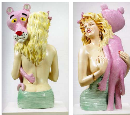
Figura 53 - Jeff Koons, "Pink Panther" - Escultura. Porcelana. 41 x 20 x 19 cm. 1988.