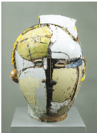
Figura 50 - Gertraud Möhwald, "Kopf mi orangem Orring". Cerâmica refratária, cerâmica vidrada e engobe. 39.5 cm. 1999.