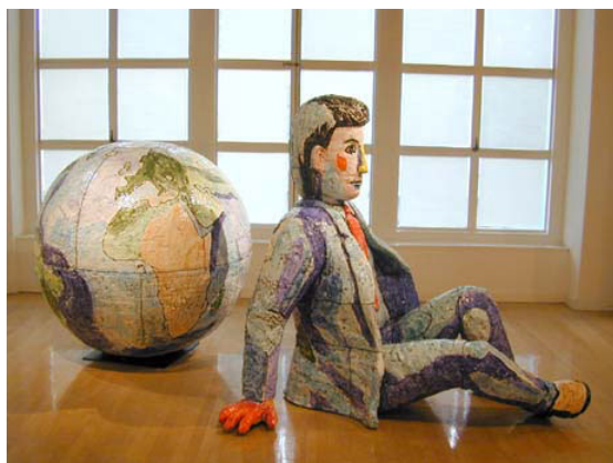
Figura 48 - Viola Frey, "Man and World" – Cerâmica vidrada. 68 x 72 x 140 cm. 2003.