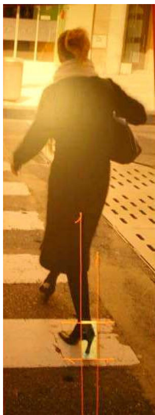
Figura 54 - Alberto Andrés, "Tacones" Fotografia e serigrafia sobre grês e cordão. 210 x 78 cm. 2004.