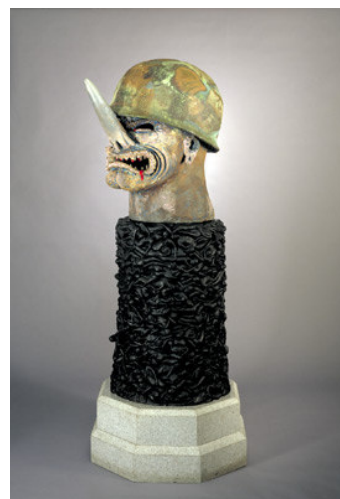
Figura 49 – Robert Arneson, "General Nuke" Cerâmica vidrada e bronze sobre base de granito. 77 x 30 x 36 cm. 1984.