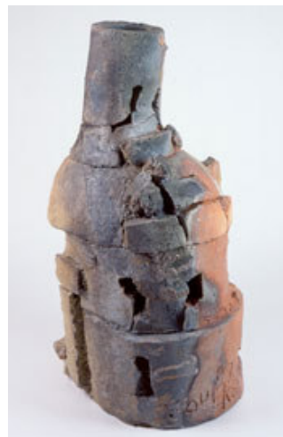
Figura 47 - Peter Voulkos, "Chachmo" stoneware. Queima a lenha. 42 x 27 cm. 1995.