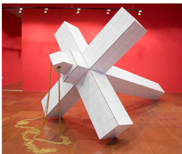
Figura 55 – Alberto Andrés, "Y pasa la gloria". Cerâmica. 2006.