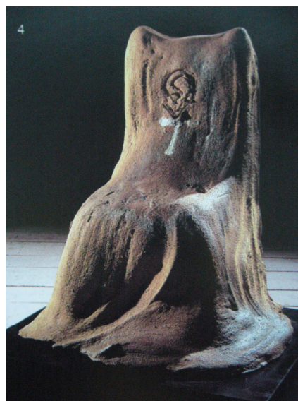
Figura 56 - Antoni Tàpies, "Cadeira coberta" Cerâmica. 90x57x30cm.