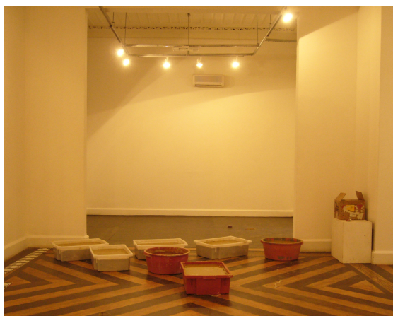
Figura 95 – Preparação da argila para a instalação.