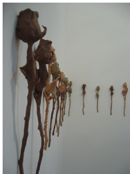
Figuras – 91 e 92 – Rosângela Costa, “Medunizado frescor” - Instalação de parede. 40 rosas cerâmicas. Dimensões variáveis. 2006.