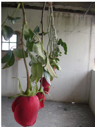
Figura 93 – Rosângela Costa. Preparação das rosas para banho de barbotina.