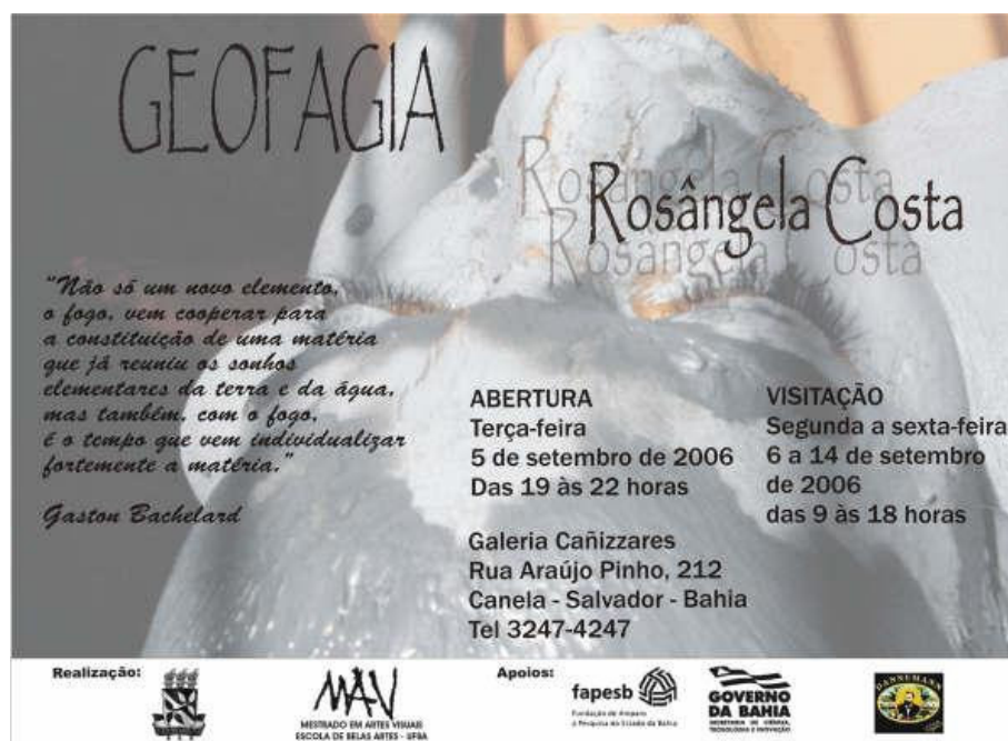
Figura 82 - Convite virtual da exposição Geofagia. Divulgação em meio virtual.