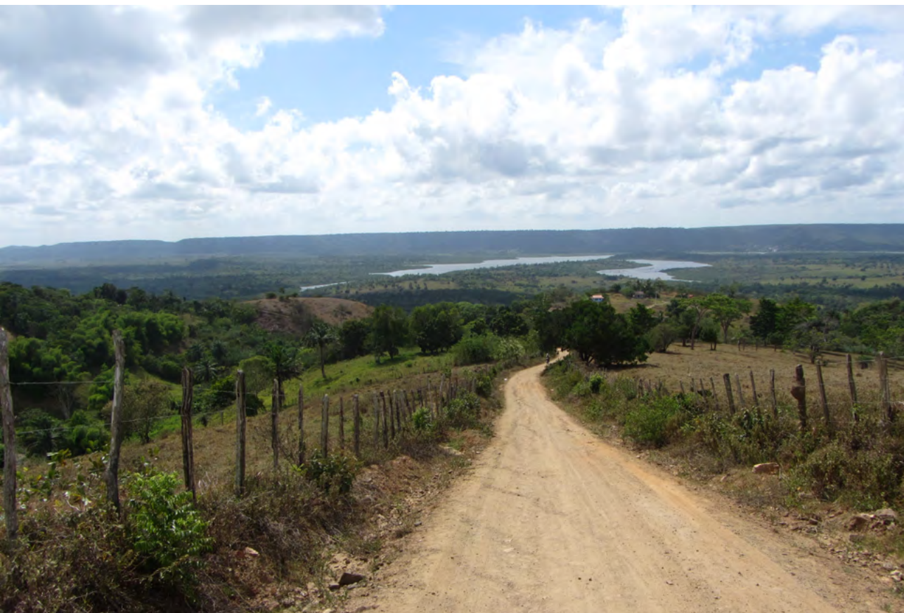
Figura 23. Caminho, tendo ao fundo a Baía do Iguape