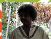
Ananias na abertura da Oficina

Encontro de benzedeiras e rezadeiras de vários quilombos de Cachoeira-BA, em 11 de março de 2017, para conversas sobre as suas práticas terapêuticas.