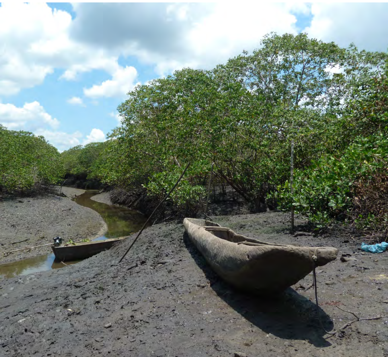
Figura 21. Canoa guardada no manguezal no período da maré baixa, Quilombo Imbiara