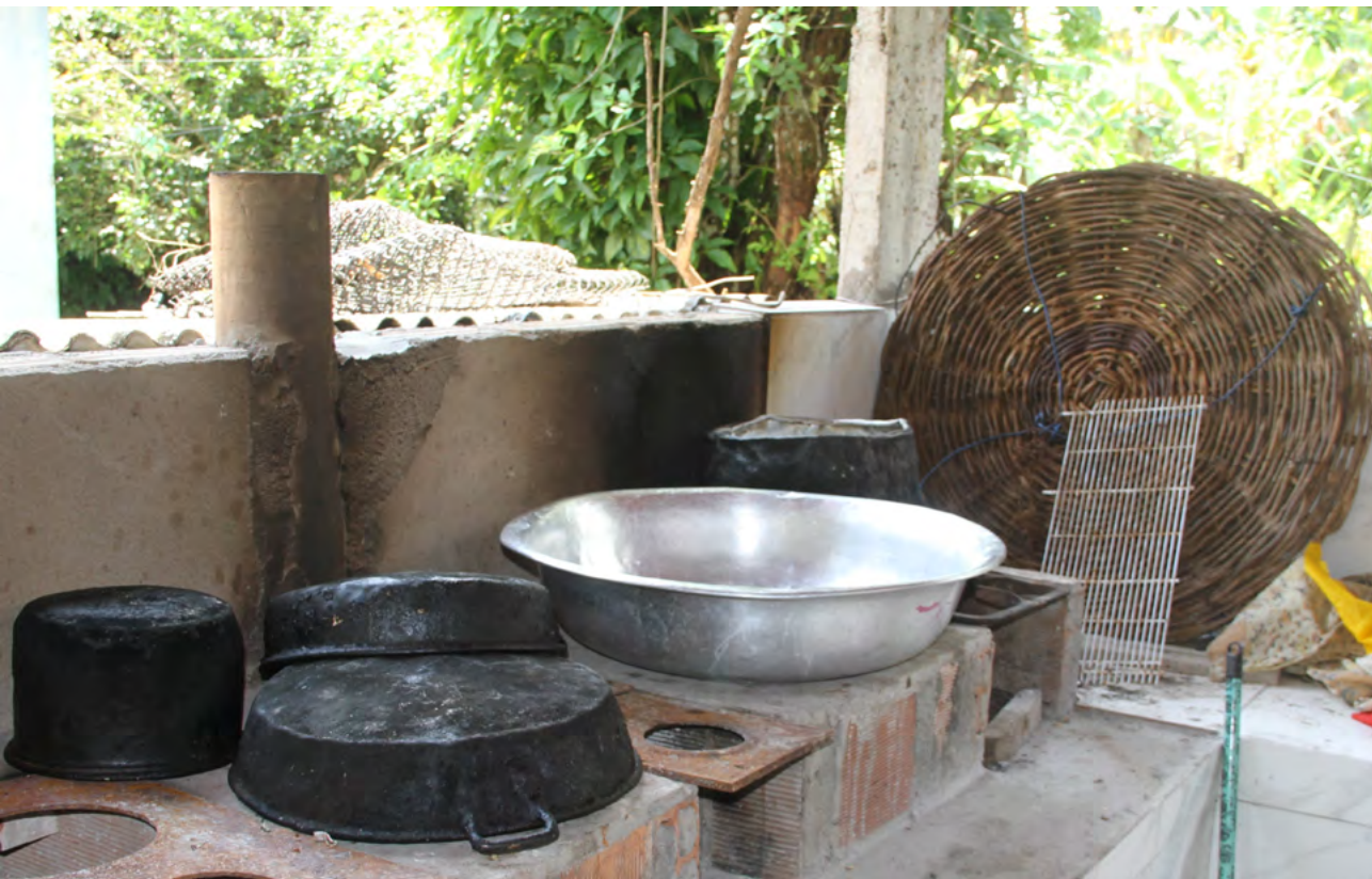
Figura 15. Fogão a lenha e artefatos de cozinha