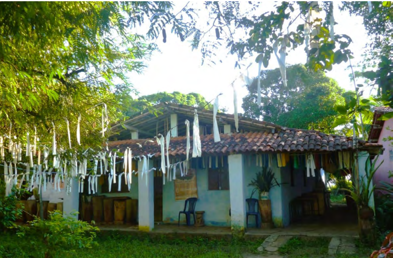
Figura 10. Terreiro 21 Aldeia de Mar e Terra, Quilombo Kaonge