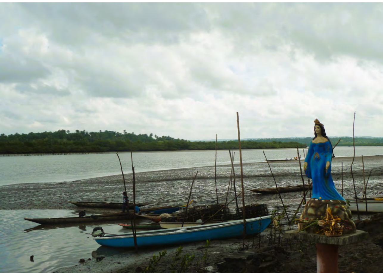
Figura 7. Imagem de Yemanjá no porto, Quilombo Santiago do Iguape