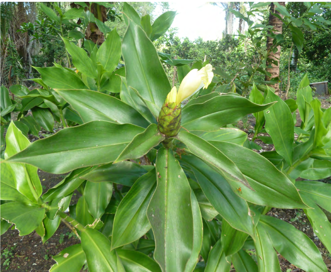
Figura 19. Cana-do-brejo/cana-de-macaco