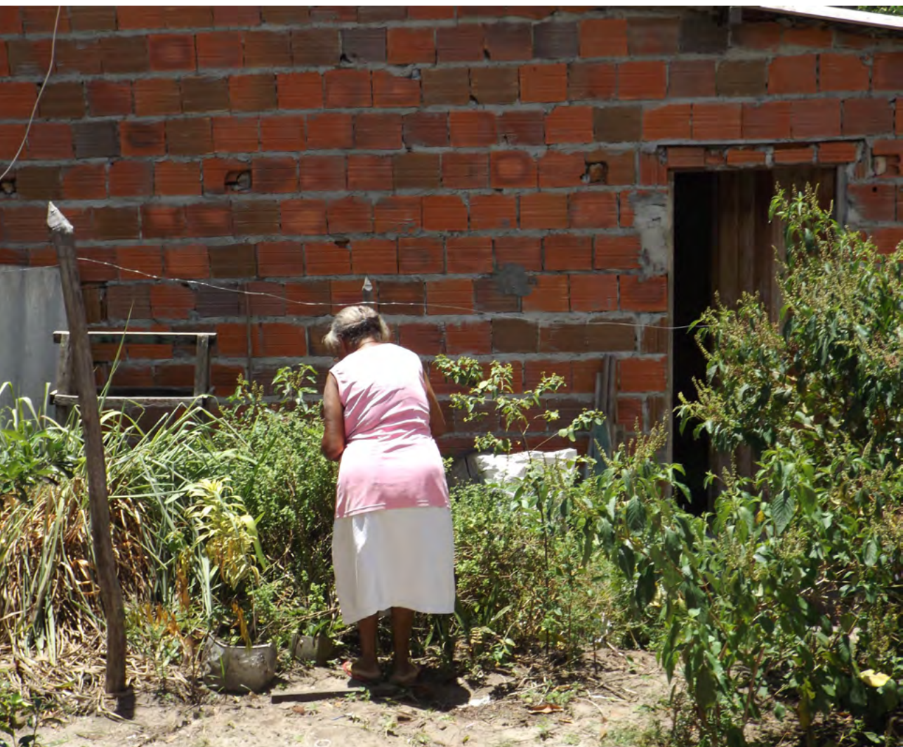
Figura 16. Cuidado com as folhas no quintal quilombola