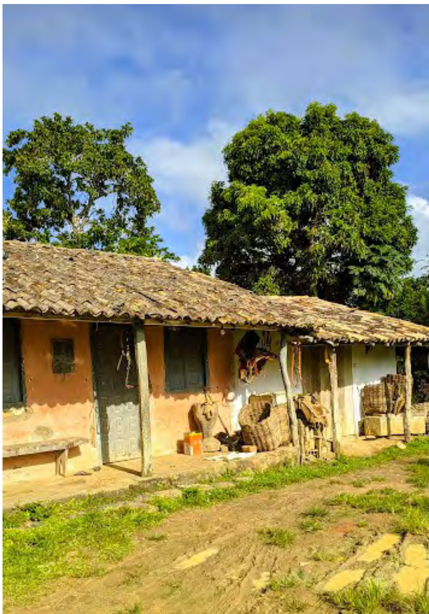
Figura 22. Casa de farinha ao fundo, Quilombo Santo Antônio e Vidal