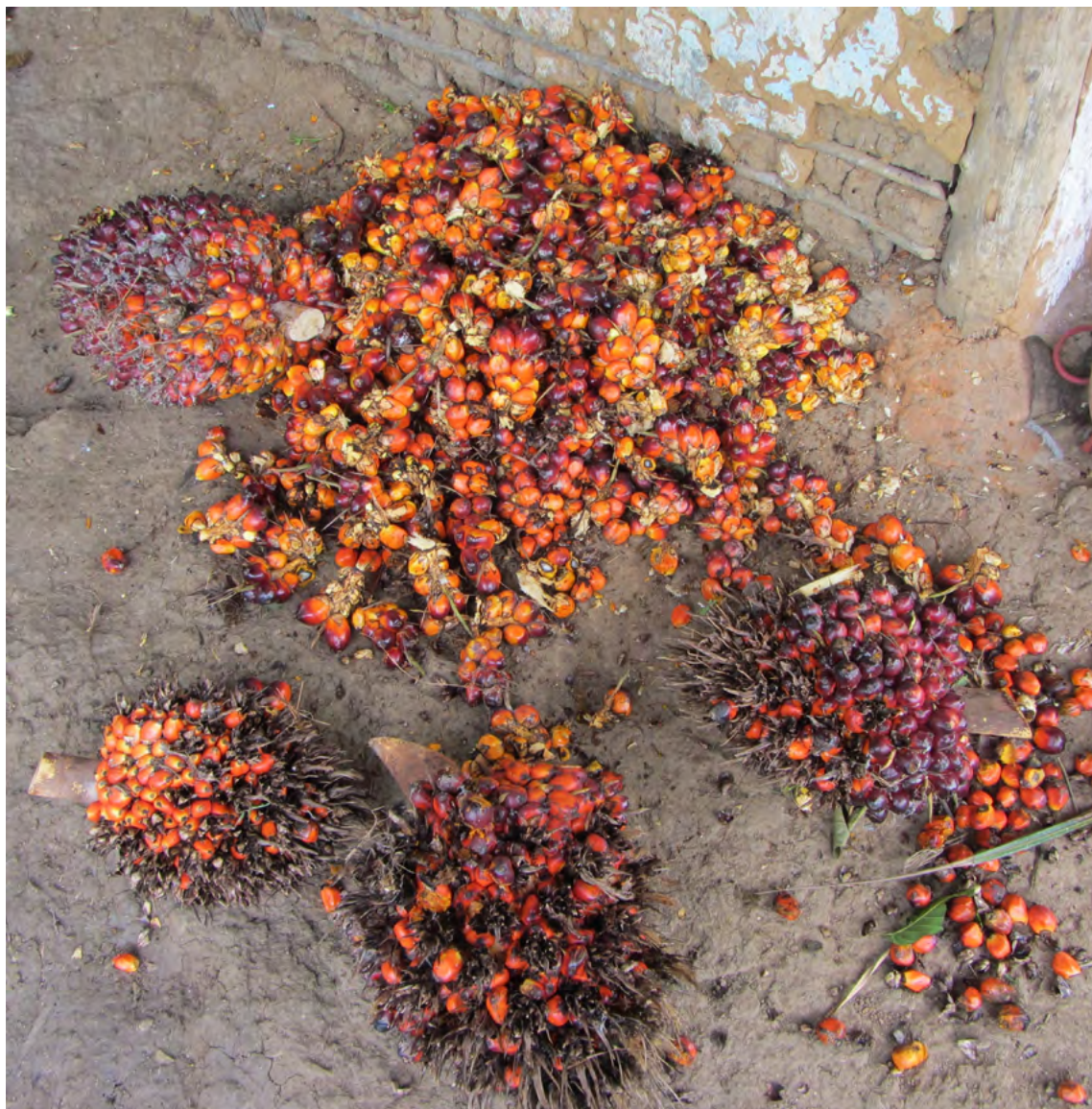
Figura 14. Cacho do dende