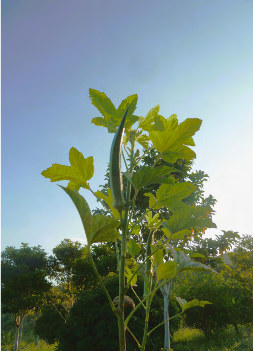
Figura 17. Pé de quiabo, folhas e fruto