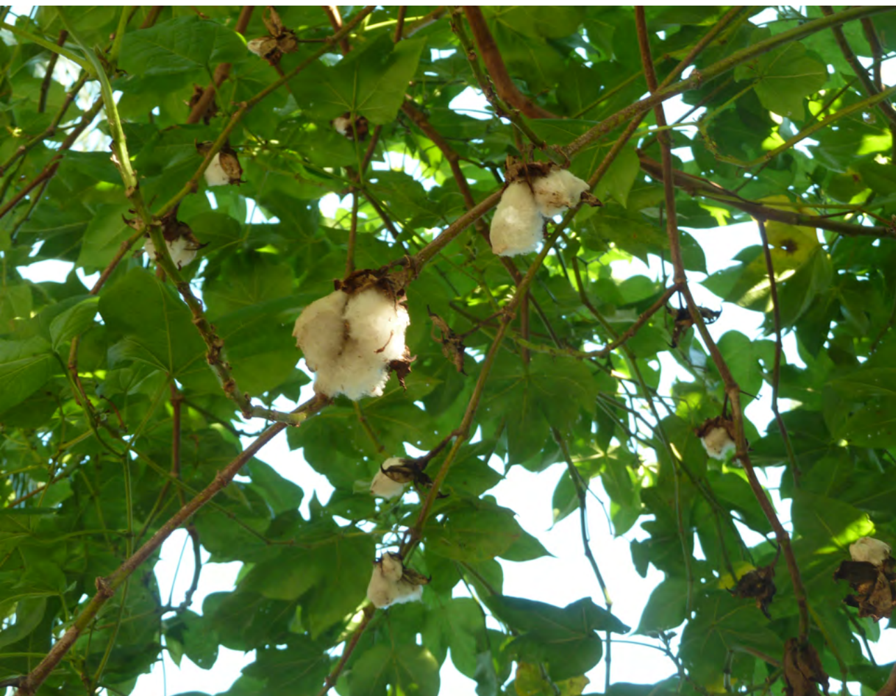
Figura 13. Planta do algodão que faz parte do acervo medicinal quilombola