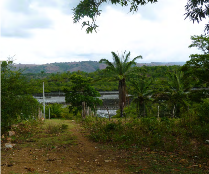
Figura 4. Área de cultivo de ostras no Quilombo Dendê

papel de tradutores –, bem como compromissos de não incorrerem no risco de nos tornarmos traidores por meio de interpretações superficiais e apressadas, que Bibeau e Corin (1995) tão bem denominam de “violência interpretativa” na interpretação antropológica.