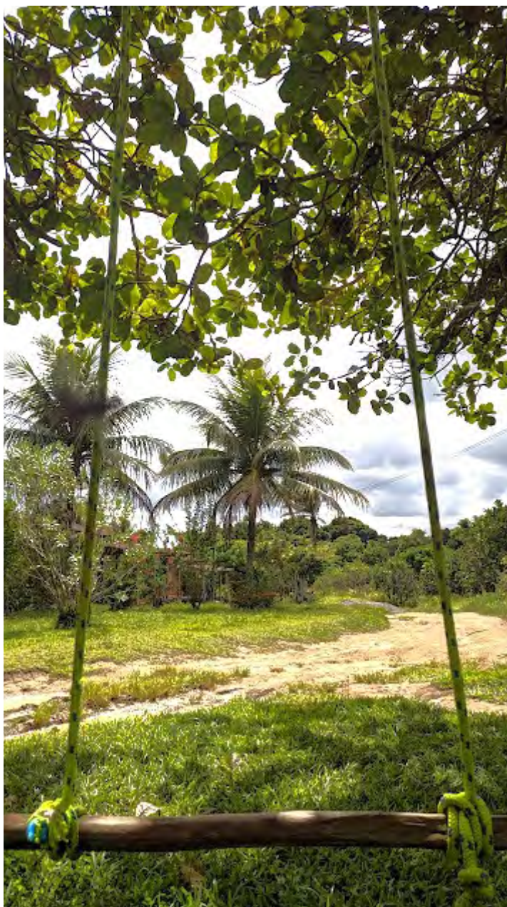
Figura 6. Equipamento de lazer infantil no Quilombo Santo Antônio e Vidal