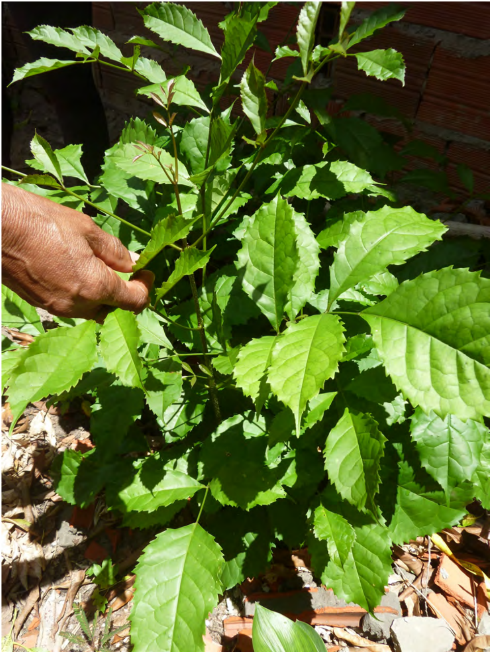
Figura 12. Hibisco, planta do acervo medicinal quilombola