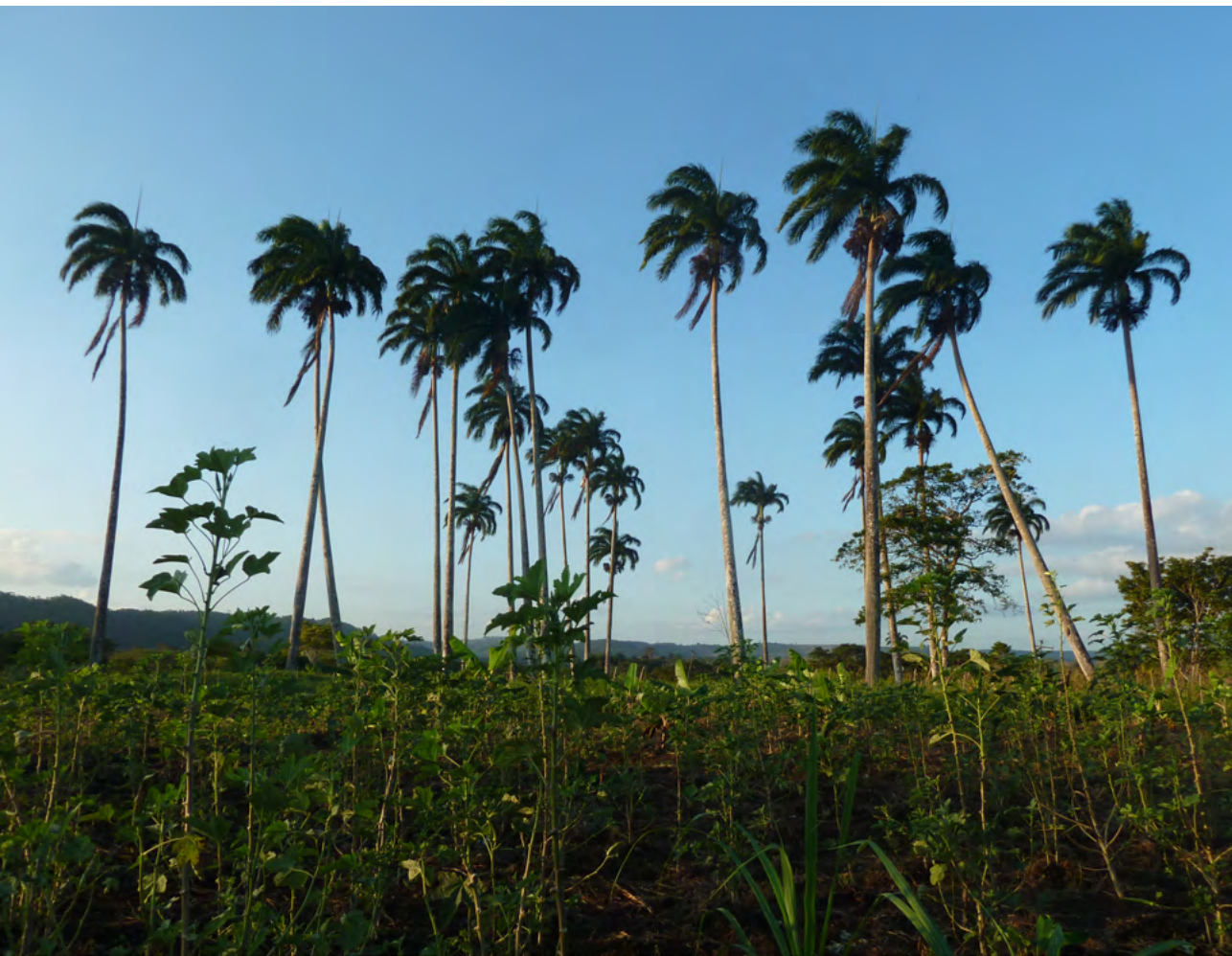
Figura 25. Palmeiras imperiais, Quilombo Tombo/Palmeira