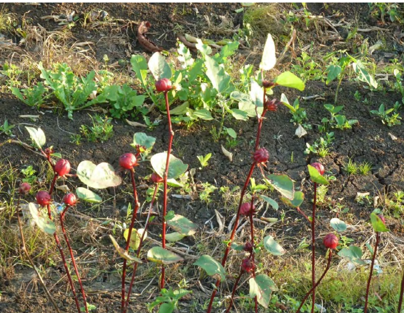
Figura 11. Canteiros de plantas, Quilombo Tombo/Palmeira