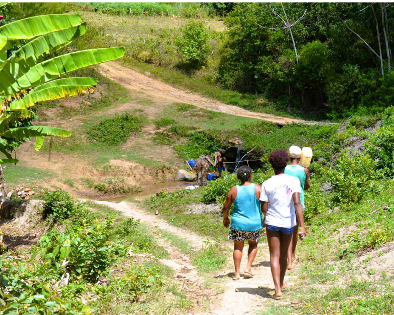
Figura 8. Fonte de abastecimento de água, Quilombo Caimbongo