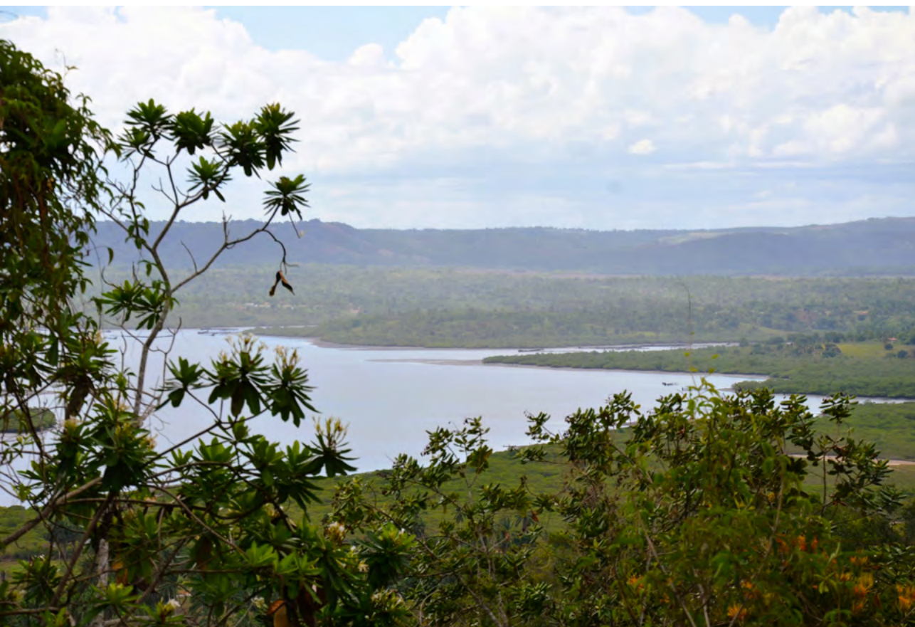
Figura 1. Panorâmica da Bacia e Vale do Iguape