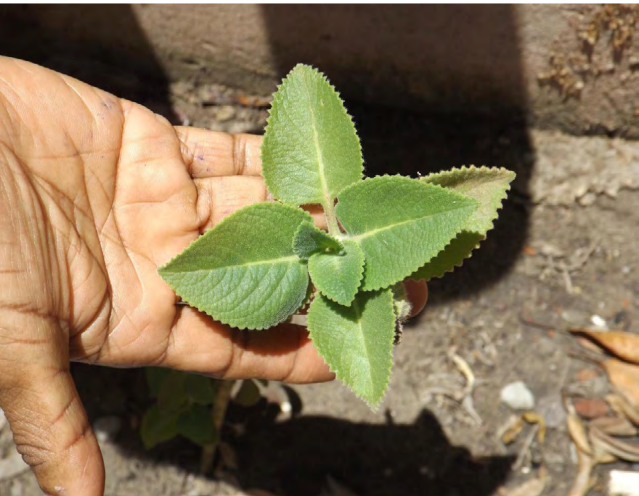
Figura 9. Folha do acervo medicinal quilombola