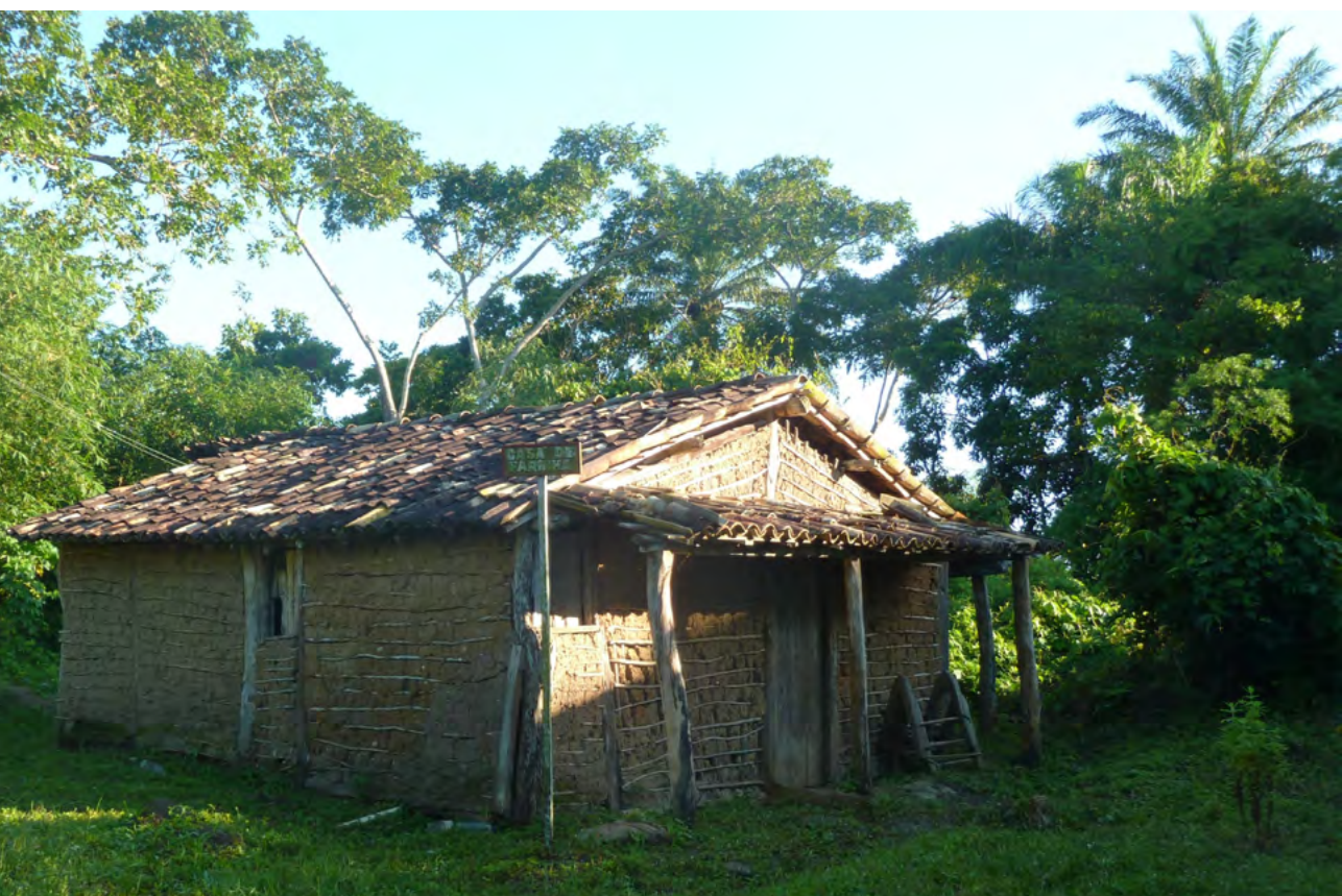
Figura 3. Casa de farinha na rota da Liberdade, Quilombo Kaonge Fonte: acervo ObservaBafa.