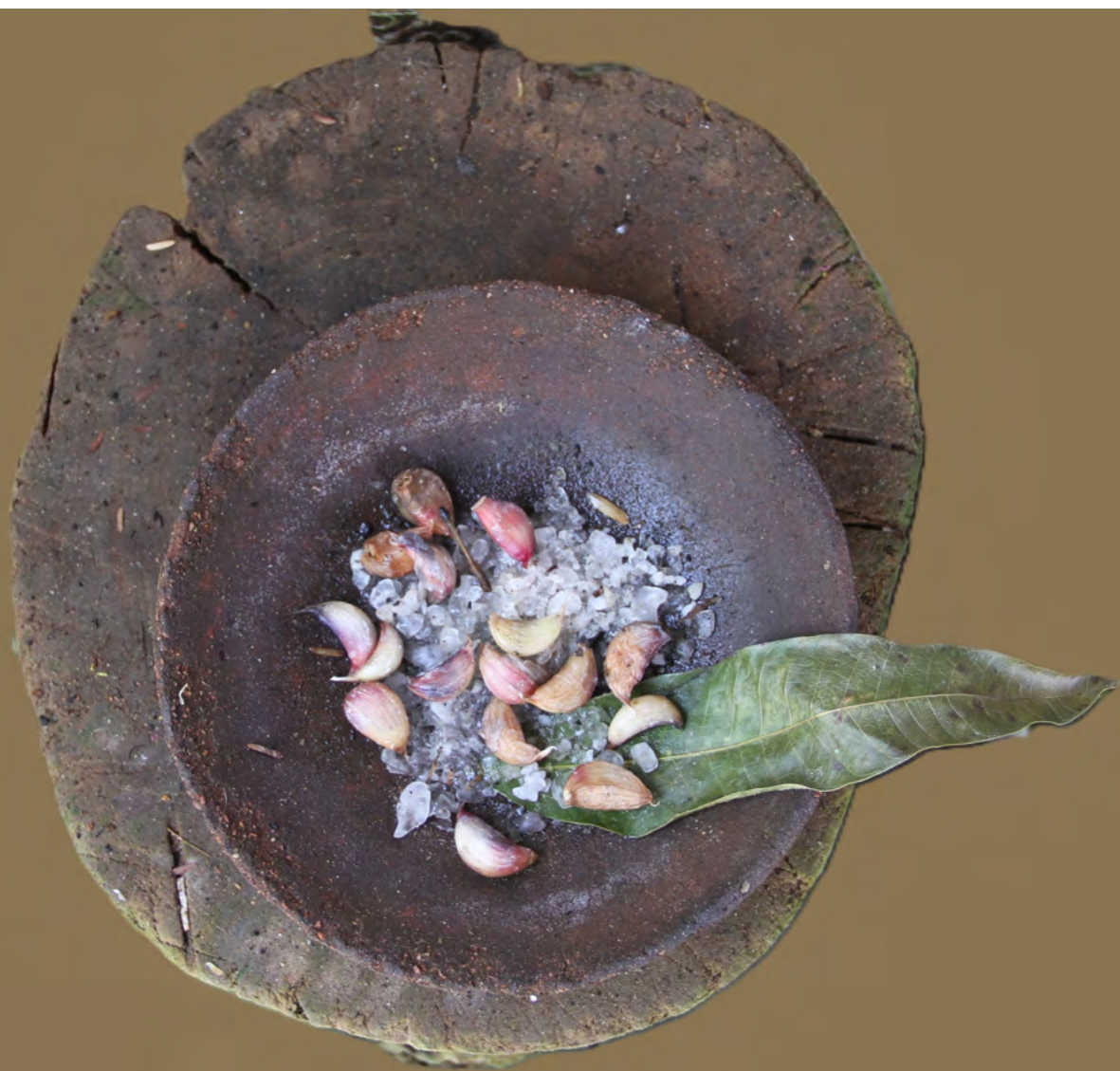
Figura 18. Pilão de madeira usado no preparo de alimentos e remédios