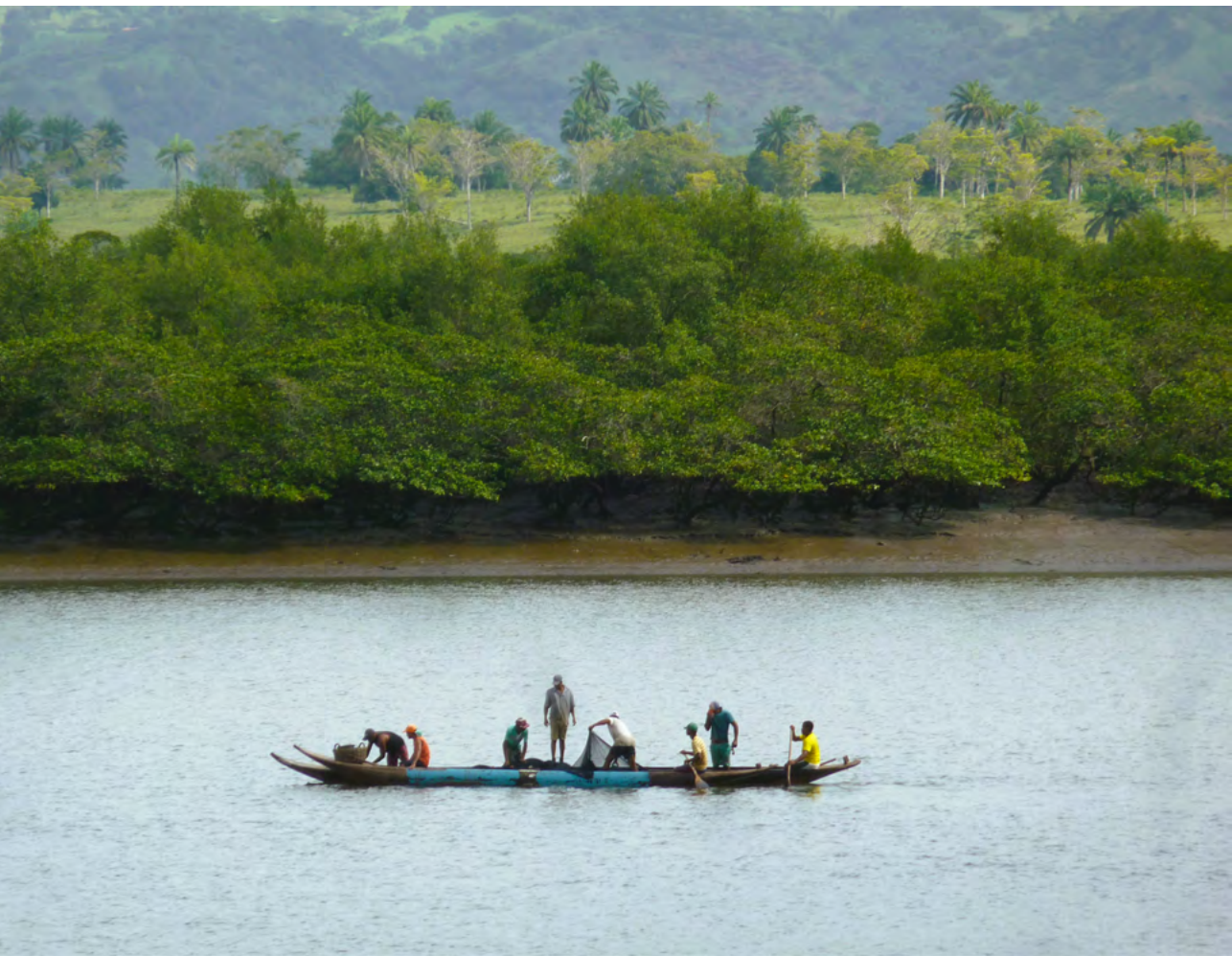
Figura 24. Pescadores na Baía do Iguape