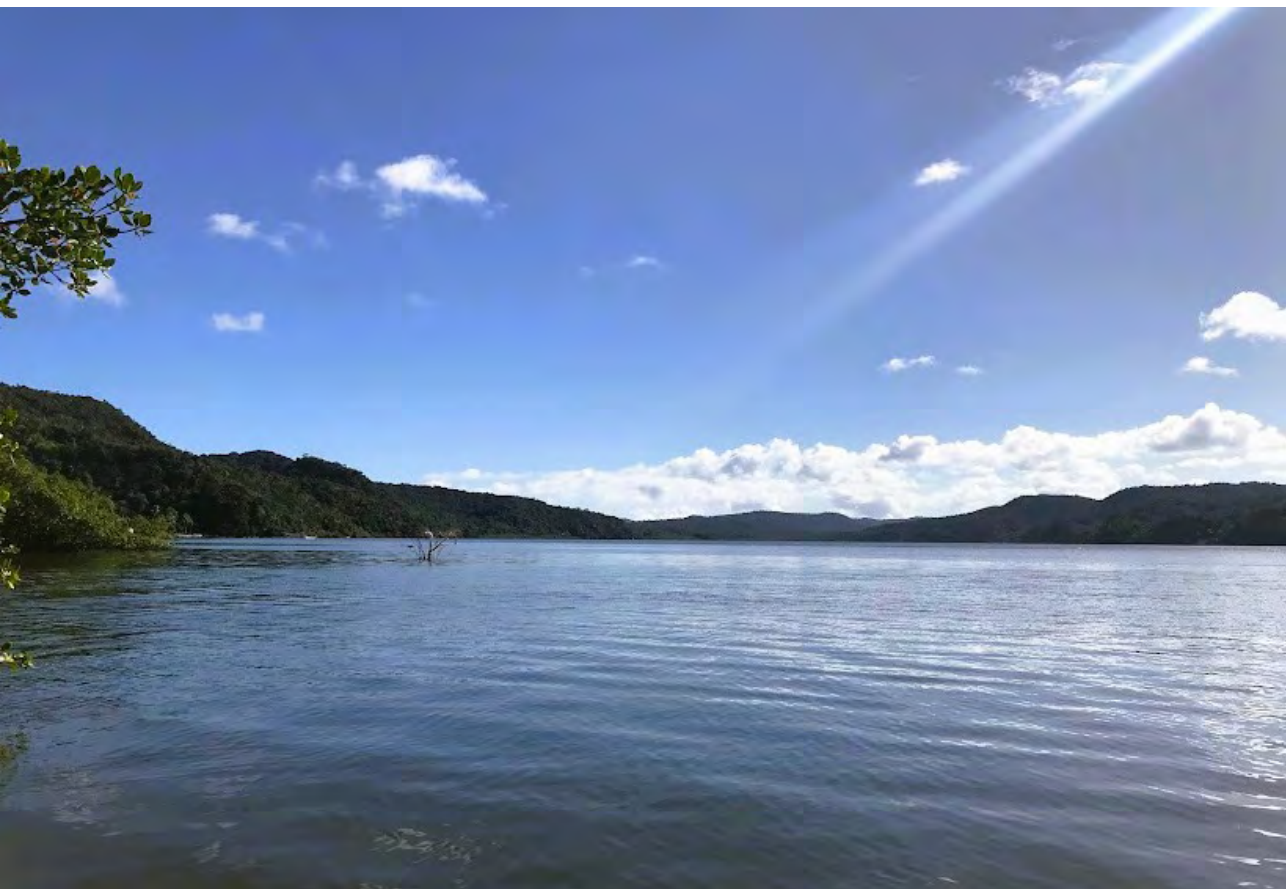
Figura 5. Panorâmica da Baía do Iguape, vista de Maragogipe