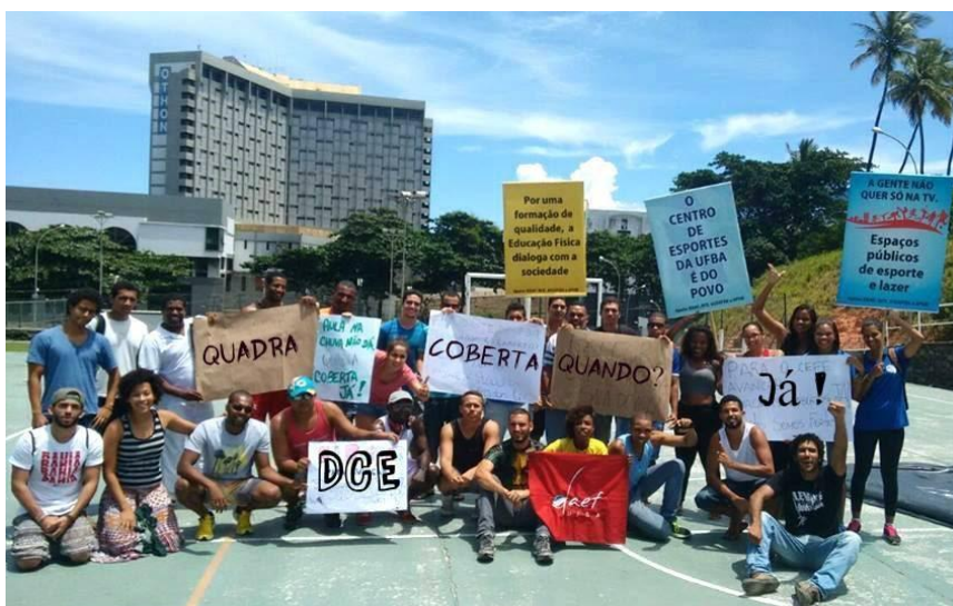
Foto 1 - Ação da Campanha “Quadra Coberta Já!” em 05/03/2015

Em 2015, iniciamos o semestre com as atividades da Semana de Calouros. Na programação do evento, em articulação com outros Centros e Diretórios Acadêmicos e o DCE, os estudantes construíram um ato público, que ficou conhecido como “Jornada de Lutas”. O ato reuniu cerca de 1000 estudantes de todos os campi da UFBA em Salvador, que caminharam de seus territórios até a Reitoria da UFBA e apresentaram para sociedade baiana as demandas que a comunidade universitária acreditava serem imprescindíveis para a permanência na universidade. No tocante a pauta desportiva, o DCE, representado pela sua Coordenação de Esportes e o DAEF lançaram juntos a Campanha “Quadra Coberta JÁ!” – dando ênfase à estrutura física precária que se encontrava o CEFE e que não garantia, minimamente, uma formação qualificada para os futuros professores que ali iriam se formar. Concomitante ao lançamento da campanha as duas entidades construíram o Projeto “CEFE em Movimento” que tinha como objetivos: a) ampliar o uso do espaço do CEFE através de atividades esportivas; b) Incentivar políticas públicas de esporte e lazer na Universidade; e c) Incluir a comunidade externa nas políticas públicas de esporte desenvolvidas na UFBA, possibilitando a estes através do esporte pudessem visualizar a universidade como uma possibilidade.