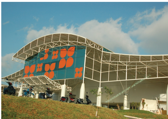
Fig. 104 — Belas Shopping, construído pela Empresa Odebrecht, Luanda, 2008