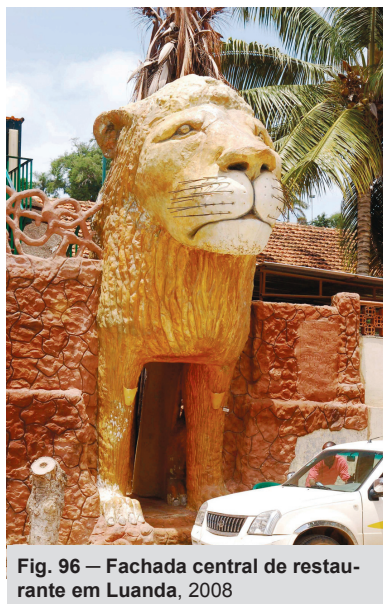
Fig. 96 — Fachada central de restaurante em Luanda, 2008