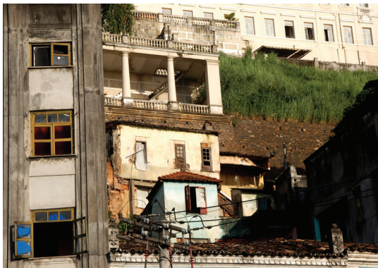
Fig. 107 — DETALHE, comércio, cidade baixa, Salvador, 2008