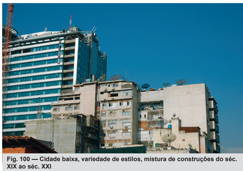
Fig. 100 — Cidade baixa, variedade de estilos, mistura de construções do séc. XIX ao séc. XXI

O que se pode perceber na cidade, atualmente, é uma explosão de construções, realizadas por empresas procedentes de várias partes do mundo. A cidade vive um momento de grande expansão do mercado imobiliário, favorecido pelo final da guerra e pela estabilidade do atual governo.