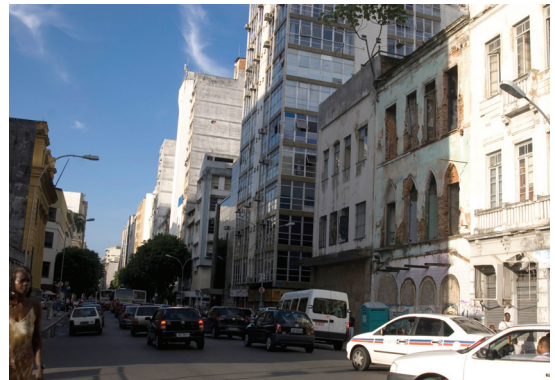
Fig. 108 — DETALHE, comércio, cidade baixa, Salvador, 2008