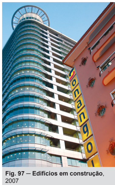
Fig. 97 — Edifícios em construção, 2007