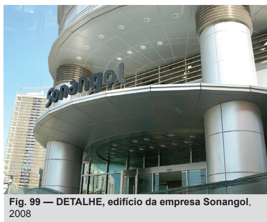
Fig. 99 — DETALHE, edifício da empresa Sonangol, 2008

O que se pode perceber na cidade, atualmente, é uma explosão de construções, realizadas por empresas procedentes de várias partes do mundo. A cidade vive um momento de grande expansão do mercado imobiliário, favorecido pelo final da guerra e pela estabilidade do atual governo.