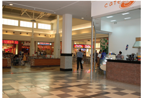
Fig. 105 — Belas Shopping, construído pela Empresa Odebrecht, Luanda, 2008