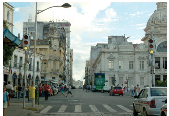
Fig. 110 — Palácio Rio Branco, Praça Tomé de Souza, Salvador, 2008