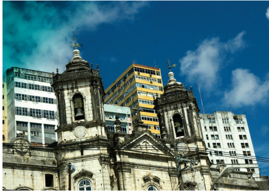
Fig. 106 — DETALHE, Igreja N. S. da Conceição, Salvador, 2008

A independência dos países africanos é um acontecimento recente, no pós-Segunda Guerra Mundial. O Brasil foi vítima de idêntico tipo de exploração que os países africanos, como dependentes periféricos do mesmo sistema capitalista. Entre os dois lados do Atlântico, existem problemas comuns que foram herdados do mesmo padrão de colonialismo que as grandes potências europeias praticaram, e outros mais recentes que foram criados pelo capitalismo.