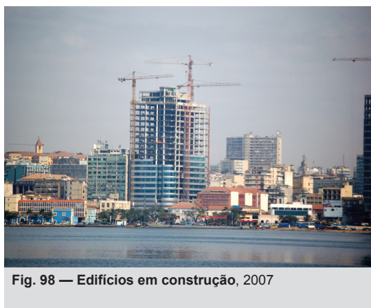
Fig. 98 — Edifícios em construção, 2007