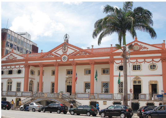
Fig. 109 — Comércio, Salvador, 2008