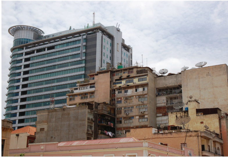
Fig. 101 — Cidade baixa, variedade de estilos, mistura de construções do séc. XIX ao séc. XXI