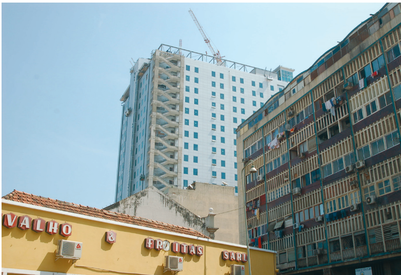
Fig. 102 — Cidade baixa, variedade de estilos, mistura de construções do séc. XIX ao séc. XXI