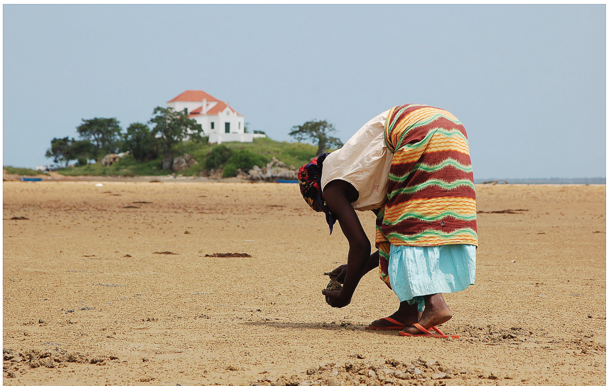
Fig. 232 — Mulheres recolhendo mariscos, Praia do Museu da Escravatura, Luanda, 2007