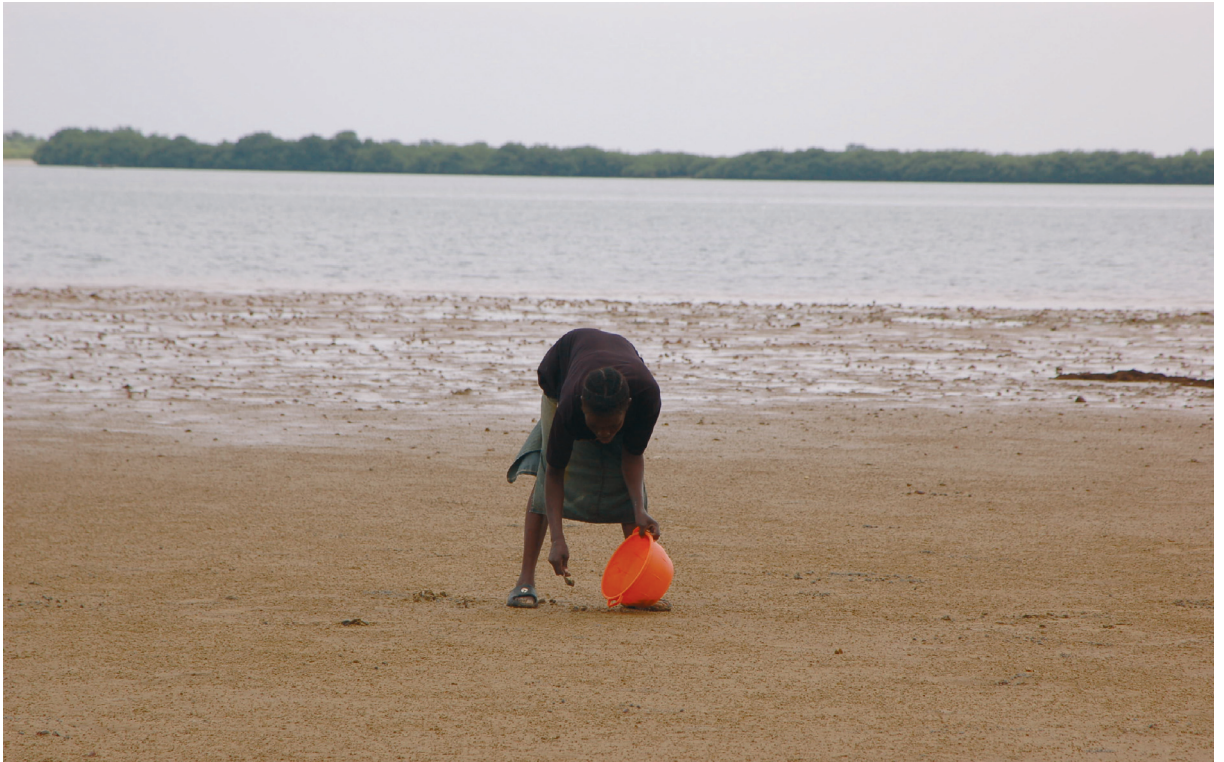
Fig. 229 — Mulheres recolhendo mariscos, Praia do Museu da Escravatura, Luanda, 2007