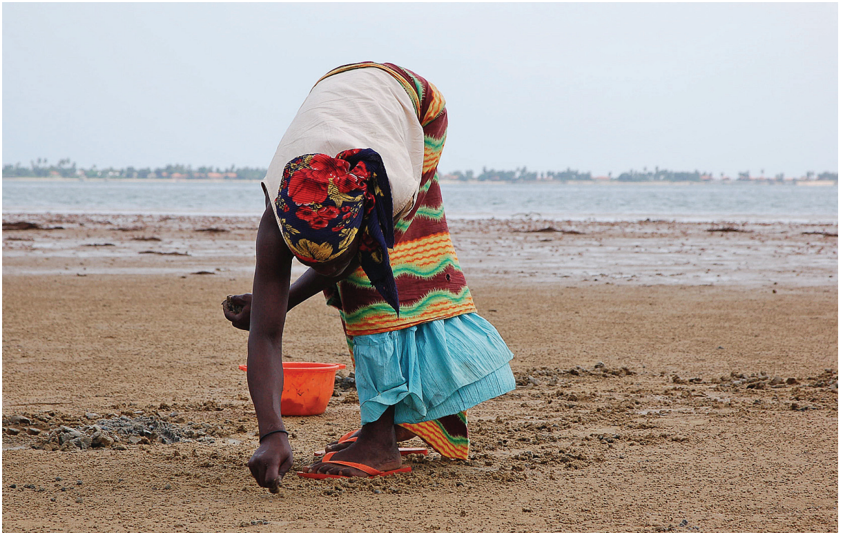
Fig. 231 — Mulheres recolhendo mariscos, Praia do Museu da Escravatura, Luanda, 2007