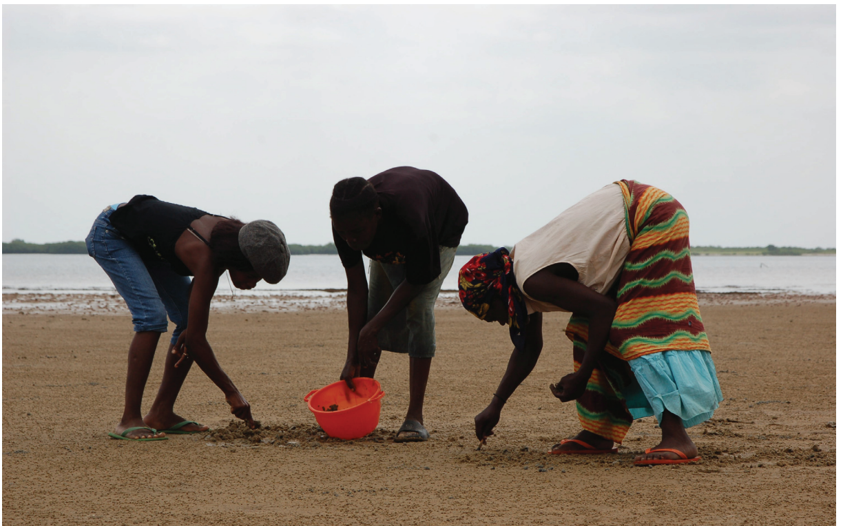
Fig. 230 — Mulheres recolhendo mariscos, Praia do Museu da Escravatura, Luanda, 2007