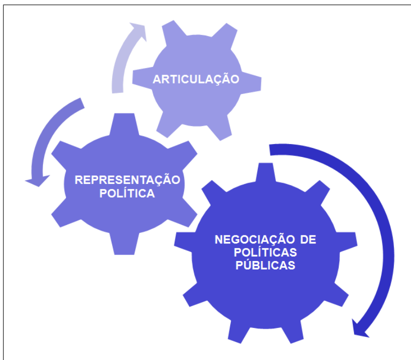
Figura 3 - Objetivos da Coordenação Estadual dos Territórios de Identidade da Bahia