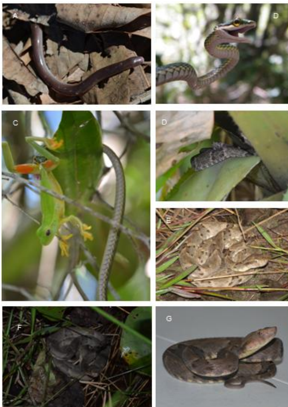
Figura 4. Serpentes coletadas na Ilha de Monte Cristo, Saubara, Bahia (A) Typhlops brongersmianus (B) Leptophis ahaetulla (C) Leptophis ahaetulla subjugando uma Hysiboas albomarginatus (D) Bothrops leucurus encontrada em uma bromélia a 1,60m do chão (E e F) Bothrops leucurus (G) Padrão de coloração de supralabial em tons rosáceos em B. leucurus Fotos ( A, C, D, F e G): Milena Soeiro Foto (B): Daniela Coelho Foto (E): Pedro Dantas.