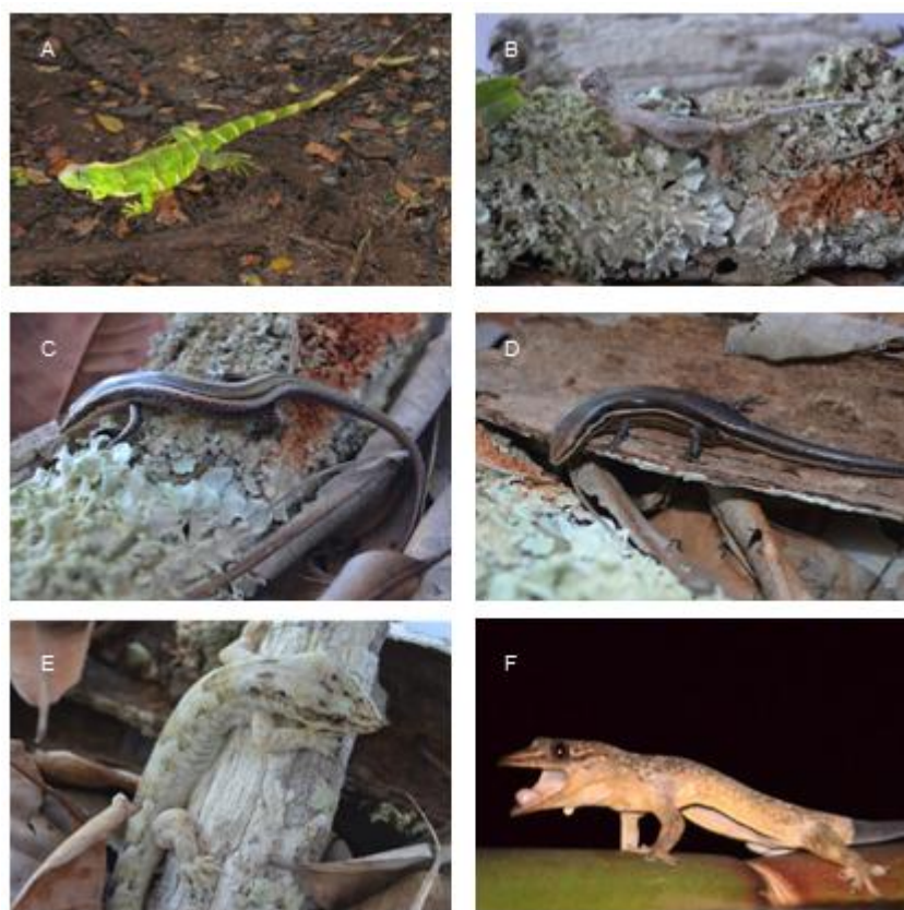
Figura 3. Lagartos coletados na Ilha de Monte Cristo, Saubara, Bahia (A) Iguana iguana (B) Norops fuscoauratus (C) Psychosaura macrorhyncha (D) Brasiliscincus heathi (E) Phyllopezus pollicaris (F) Phyllopezus lutzae