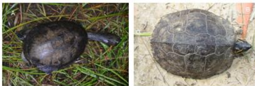
Figura 5. Quelônios coletados na Ilha de Monte Cristo, Saubara, Bahia (A) Acanthochelys radiolata (B) Rhinoclemmys punctularia