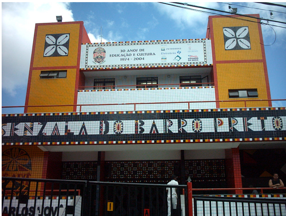
Figura 30. Sede do Ilê Aiyê, Bairro da Liberdade, Curuzu, Salvador-BA.