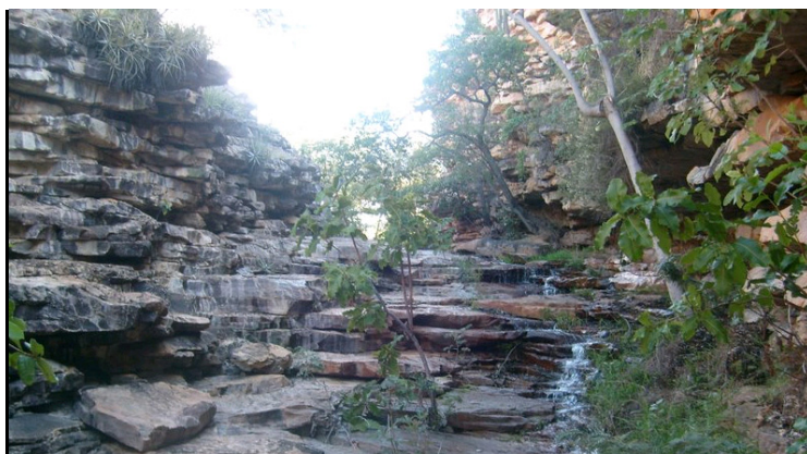
Foto 26 – Riacho Largo, localizado nas proximidades, sítio arqueológico. (01/05/2008)