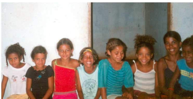
Foto 29 – Companheiras de rodas de leitura e colaboradoras (26/10/2006)