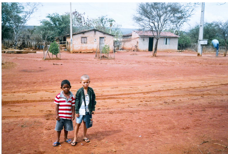
Foto 31 – Visitas ilustres, nossa casa como extensão da escola (25/10/2006)