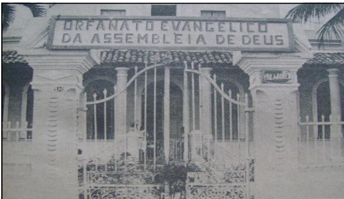
Foto 6. Antigo prédio do Orfanato da Assembléia de Deus em Feira de Santana. 06 out. 82.