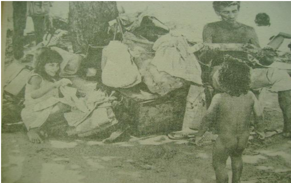
Foto 5. Família migrante. Situação de diversas famílias migrantes, fugidas da seca e da falta de trabalho. Foto do jornal Feira Hoje de 23 de fevereiro de 1984.

Charles Santana também abordou o problema da migração, entre os anos 1950 a 1980, atrelada à seca e a expulsão dos trabalhadores da zona rural, que recorreram a Feira de Santana na tentativa de conseguir trabalho 171 .