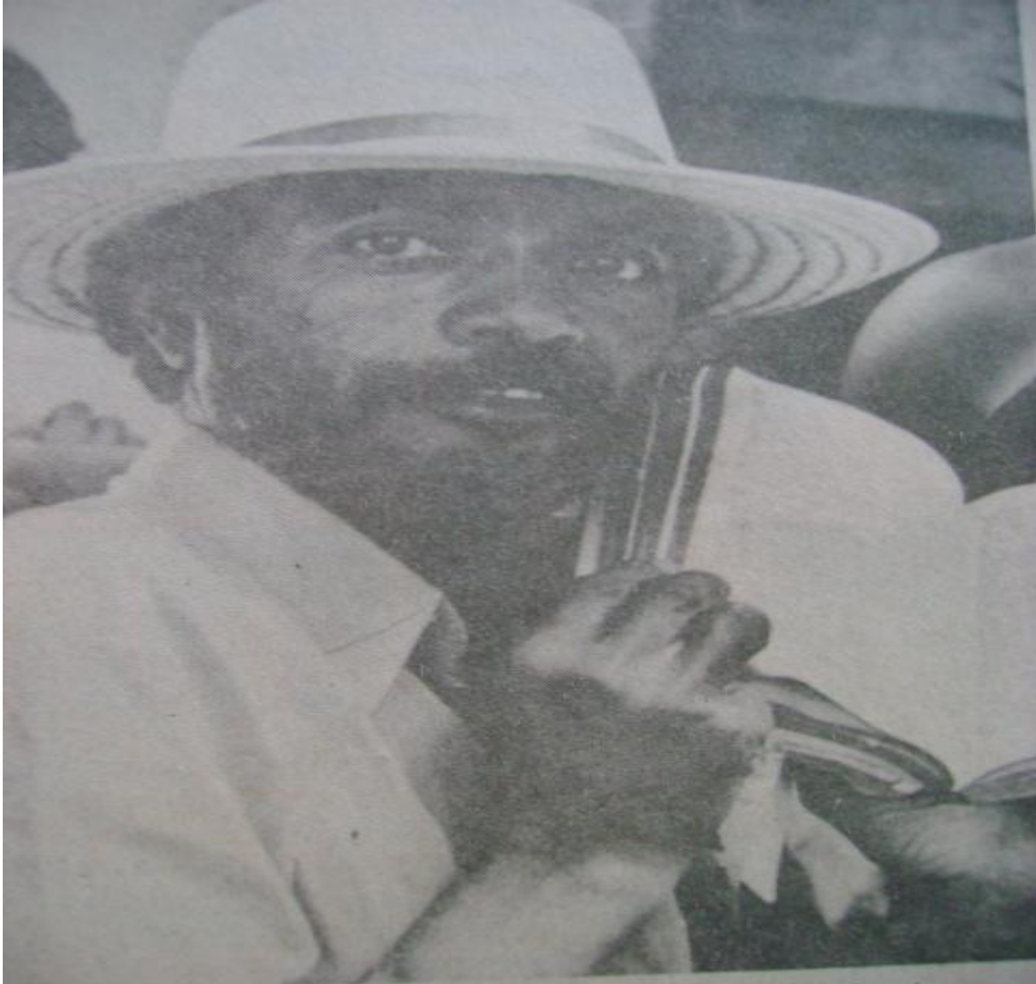
Foto 4. Migrante protestante fugindo da seca. Senhor protestante, demonstrando a força do protestantismo com o aumento do número de flagelados na seca e que encontraram na religião um dos alentos para a crise social. Jornal Feira Hoje , 30 out. 1983, p. 3. O retirante da foto fugiu da seca em Araripina – Pe, vindo para Feira de Santana mediante a fama de progresso da cidade que “corria” na região. Segundo retirante, caso achasse trabalho e moradia de aluguel, permaneceria na cidade. Caso contrário, retornaria a sua região.

Nem a própria Assembléia de Deus escapou de ter seu terreno invadido. O grupo religioso já estava consolidado no município feirense, bem como em todo o território nacional, com diversas congregações espalhadas por todo o País. Contava com mais de 40 congregações na década de 1980, espalhadas por todo o território feirense. O terreno invadido destinava-se a construção da congregação do Alto do Cruzeiro, bairro periférico da cidade. Para assegurar a construção do novo templo, os assembleianos estiveram no local para retirar os invasores. O evento gerou conflitos e diversas notas nos jornais, pois os irmãos