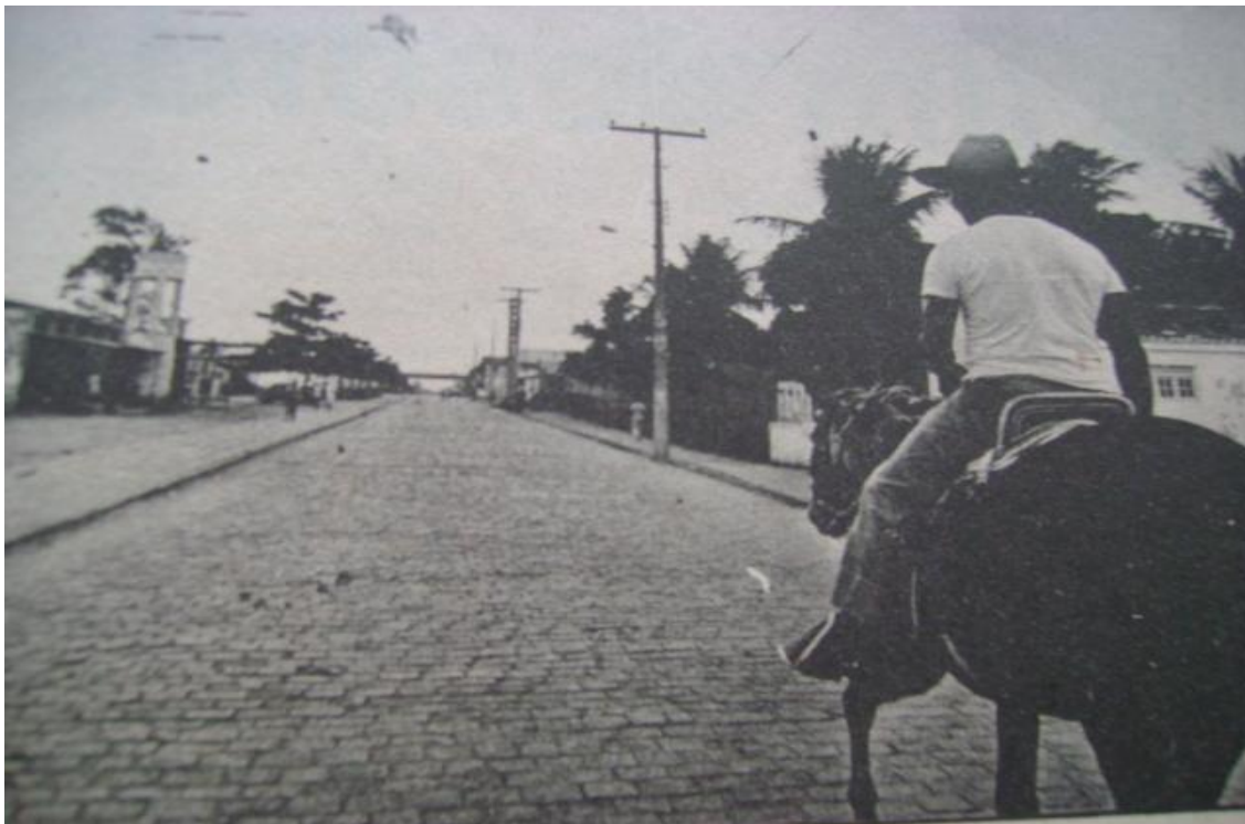
Foto 2. Modernização em Feira de Santana. Imagem do Jornal Feira Hoje para retratar o desenvolvimento urbano de Feira de Santana. Note no centro da imagem a pavimentação da rua e no canto direito da imagem uma alusão a figura do vaqueiro cedendo espaço para o urbano. Jornal Feira Hoje . Feira de Santana. 14 mar. 1983, p. 5.

que desenvolviam atividades agrícolas e que possuíam comércio ou eram negociantes.