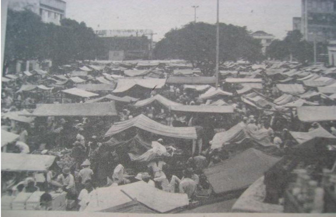
Foto 3. A tradicional feira. O modelo urbanístico pensado para Feira de Santana não comportava a existência de uma feira livre em meio ao centro da cidade, o que levou a sua mudança parcial para o Centro de Abastecimento. Jornal Feira Hoje . Feira de Santana. 14 mar. 1983, p. 5. (foto de 1975)

Na tentativa de modernizar a cidade, a tradicional feira livre, espalhada por grande parte da Avenida Getúlio Vargas, foi transferida para a chamada Central de Abastecimento de Feira de Santana, o Centro de Abastecimento. Visava limitar o comércio a uma única área, de modo a manter a higiene do local, bem como atender aos interesses modernizantes. Sobre a Central de Abastecimento, Cruz abordou: