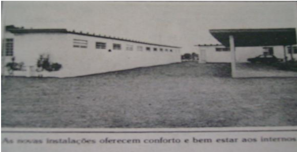
Foto 8. Centro de Recuperação Desafio Jovem da Assembléia de Deus de Feira de Santana, no distrito de Humildes.

A formação do Centro de Recuperação Desafio Jovem da Assembléia de Deus, fundado em 1980, comprovou esse interesse político do grupo. Segundo seu estatuto, o “Desafio Jovem” era uma instituição religiosa, civil, filantrópica, sem fins lucrativos. Ainda conforme o estatuto, o Desafio Jovem de Feira de Santana, Entidade Cristã, tem por finalidade, a recuperação de jovens e qualquer pessoa viciada em tóxicos, psicotrópicos, alcoolismo e demais problemas de ordem física, moral e espiritual 194 . Nos 65 anos de comoemoração da AD a assistência social não foi esquecida dentre as atividades que se destacavam na Denominação. A respeito do CRDJ foi comentado: