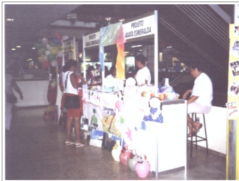
Feira de Artesanato

Objetivo principal: Oportunizar às entidades um espaço de mostra do seu trabalho