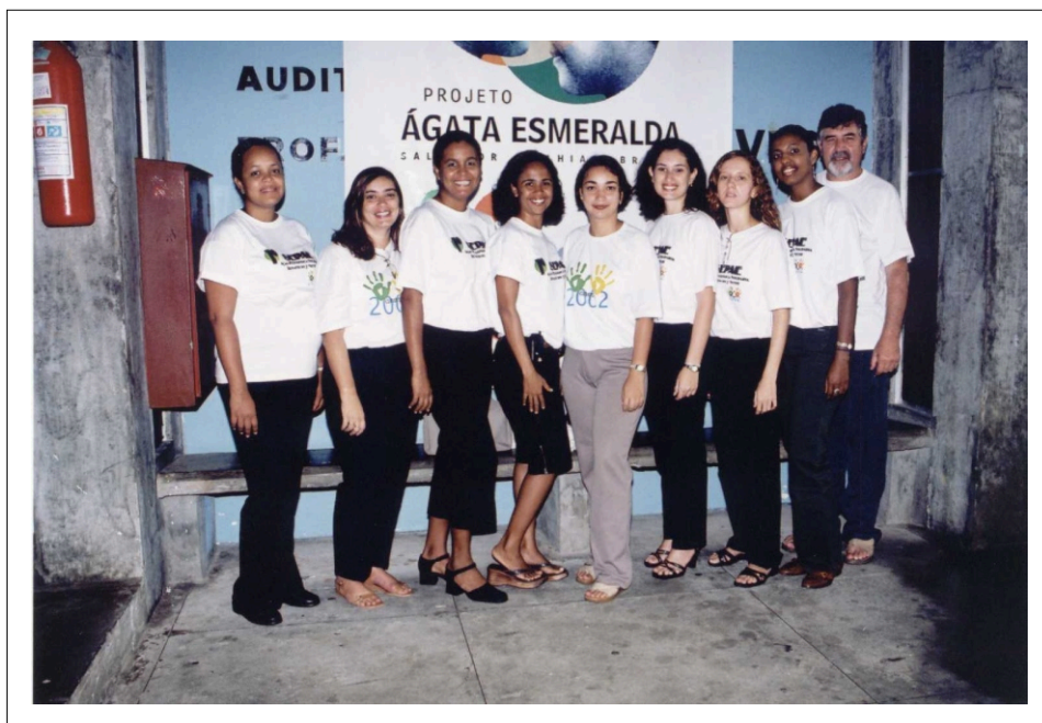
Equipe organizadora do 1º SEPAE