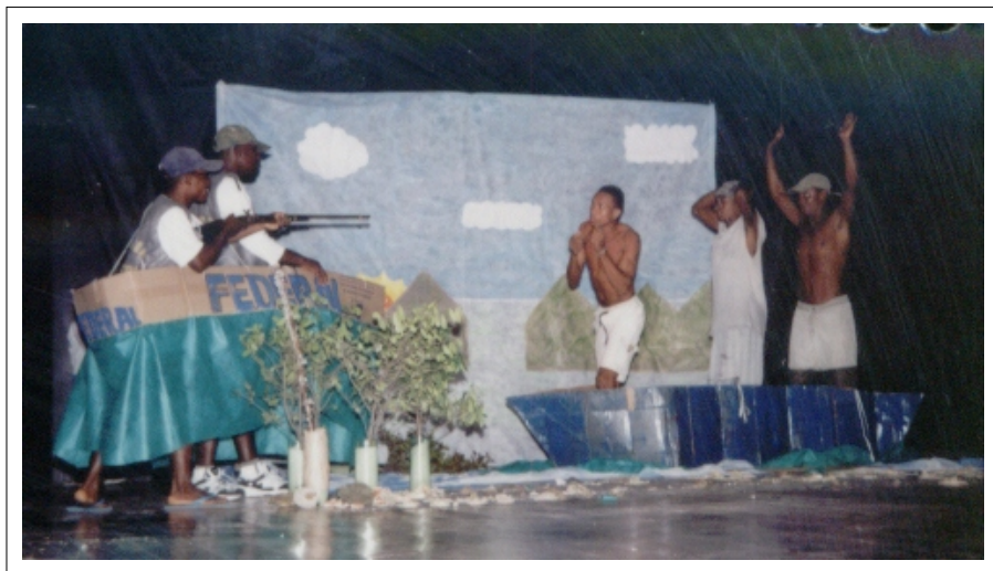
Festival de Teatro

Objetivo principal: Investir na produção cultural realizada pelas comunidades parceiras