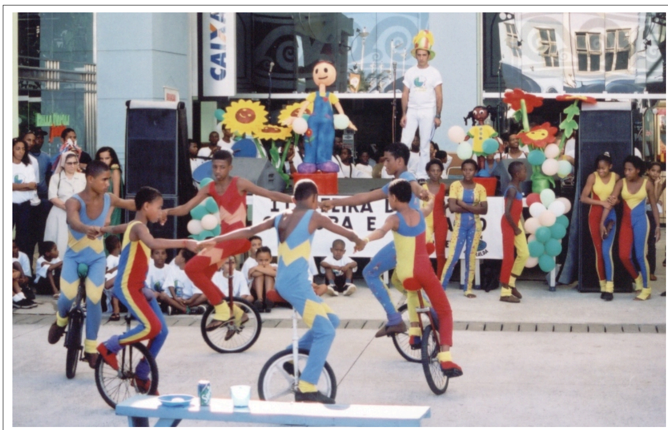
Atividades da Escola de Circo Picolino - Convênio Ágata Esmeralda Local: Evento Aeroclub Plaza Show, 2001