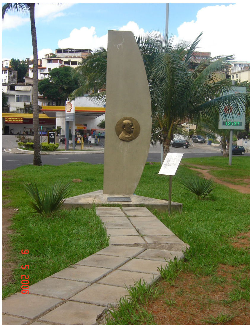
Figura 3 - Obelisco mestre Bimba

A Prefeitura Municipal de Salvador mais uma vez homenageia Mestre Bimba com um obelisco em forma de berimbau, contendo insígnia de bronze com o rosto de Bimba; situada na Praça do Capoeirista, popularmente chamada de Praça Mestre Bimba, situada no final do bairro do Rio Vermelho e no início de Amaralina, precisamente no início da Av. Amaralina. Hoje, esse local é por demais freqüentado por capoeirista do mundo inteiro que vêm prestar sua singela homenagem. É comum os mestres de capoeira reunirem seus alunos e, no local, prestarem homenagem realizando rodas de capoeira, fazendo a limpeza local e contando em tom de aula a história do grande mestre.