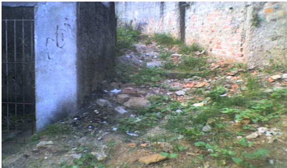
Entulhos obstruindo o caminho que levam ao sindicato.

Como veremos adiante, o que separa esses dois homens não é apenas uma mera diferença de opinião. É toda uma época e um conjunto de representações sociais, sobretudo no que se refere às formas de luta política e à significação da vinculação partidária para o sindicato. Além disso, toda uma geração se interpõe entre eles. A perspectiva geracional impõe-se aqui para compreender as particularidades dessa memória. Na geração de sindicalistas de que Seu VADO fez parte, o vínculo sindical não acabava com a aposentadoria. Ele mesmo possui a carteira de “associado aposentado”. A solidariedade que unia os companheiros não terminava com a aposentadoria: