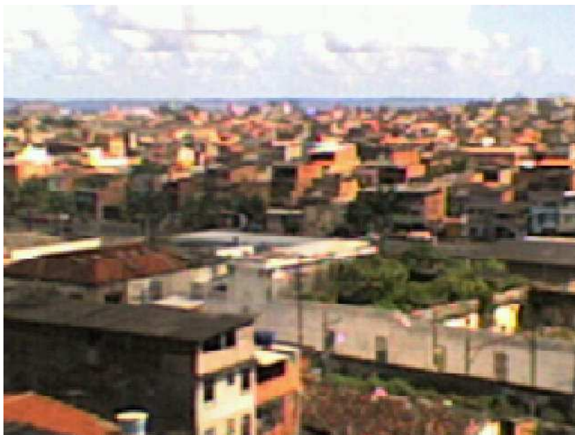
Rocinha dos Fiaes.