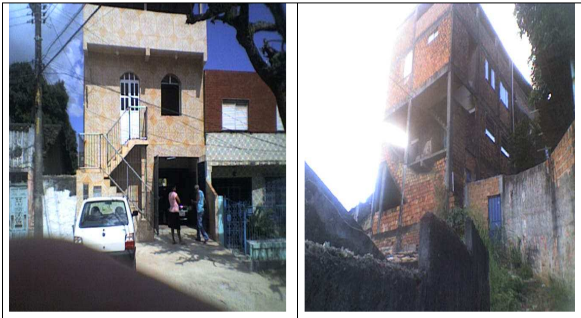
Entrada do Sinditêxtil.