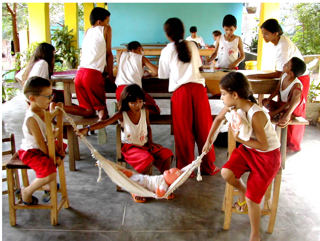
Figura 65 – Convivências (4)