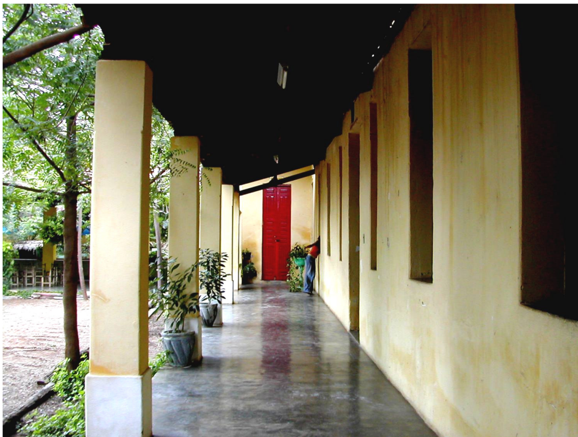
Figura 68 – Simetrias e Arquitetura (2) Corredor do Educandário