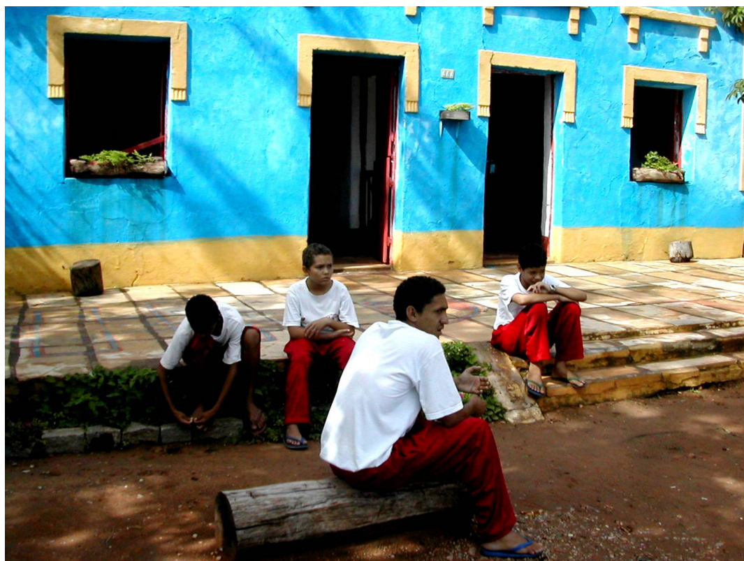
Figura 63 – Convivências (2)