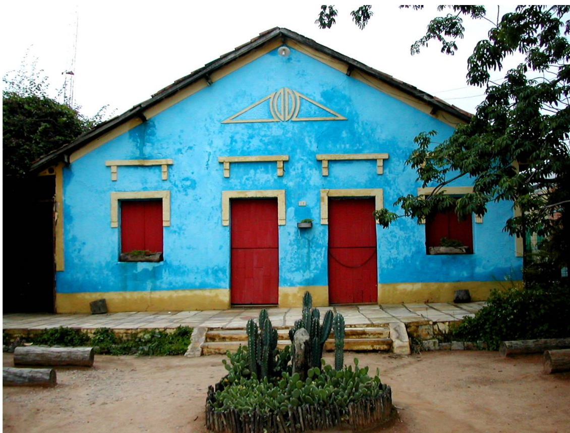
Figura 67 – Simetrias e Arquitetura (1) Fachada do Memorial do Homem Kariri