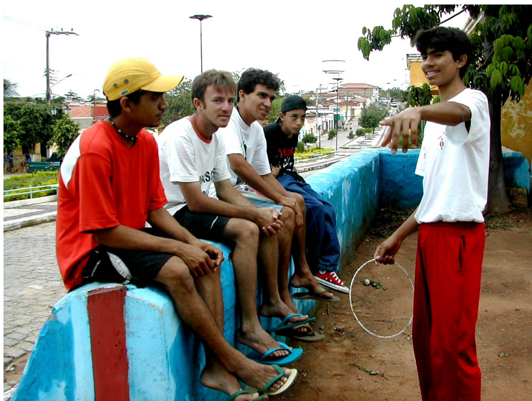
Figura 64 – Convivências (3)