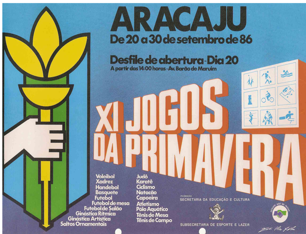
Cartaz dos "XI" Jogos da Primavera (1986).