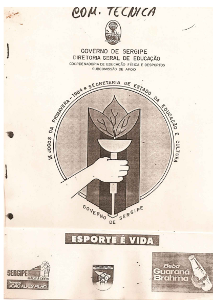
Cartaz dos "IX" Jogos da Primavera (1984).