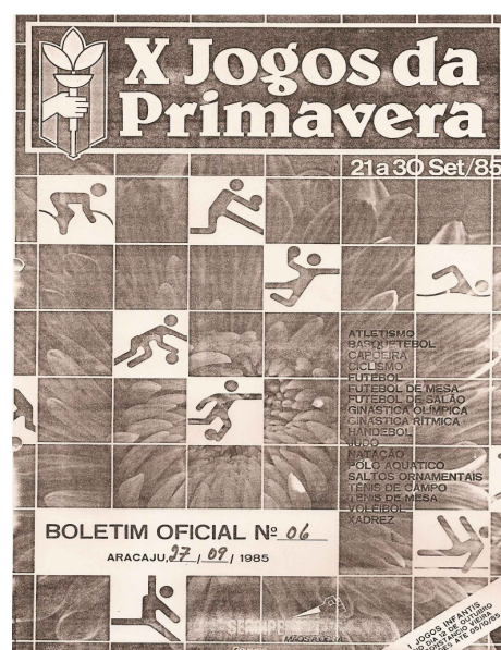
Cartaz dos "X" Jogos da Primavera (1985).